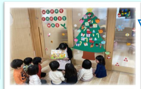
クリスマスのお話