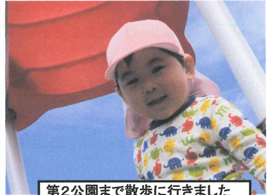
第2公園まで散歩に行きました