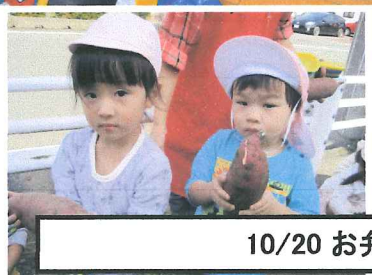
10/20 お弁当の日、芋ほり